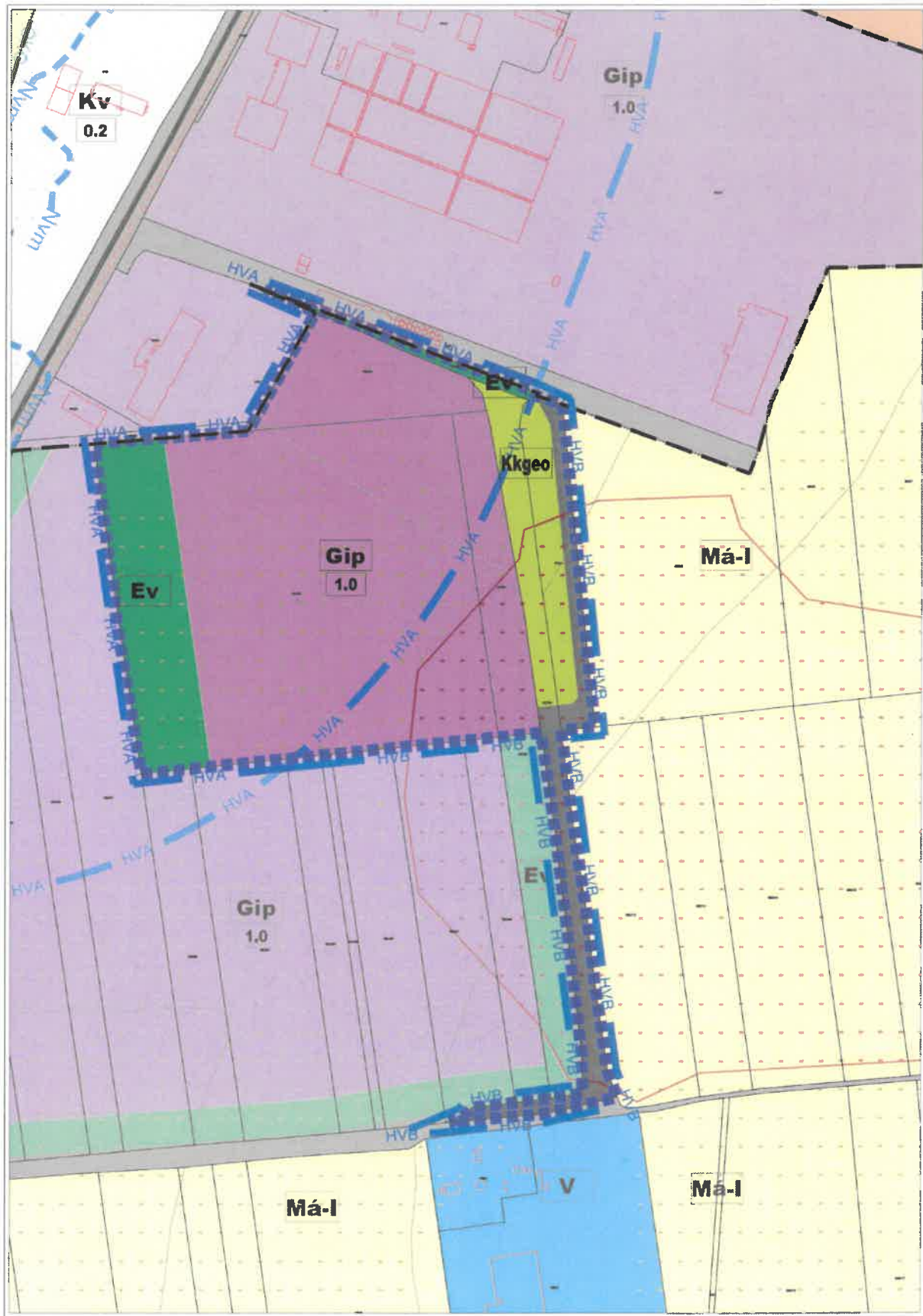
M = 1:4000